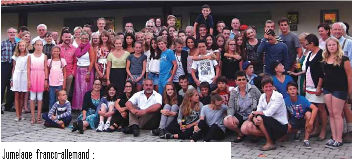
Délégation allemande et française lors d'une visite à Nussdorf en 2013.