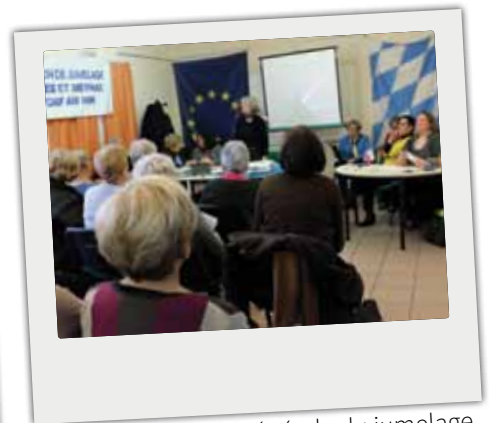
■ Assemblée générale du jumelage Nussdorf / Camblanes et Meynac, le 7 février 2015.