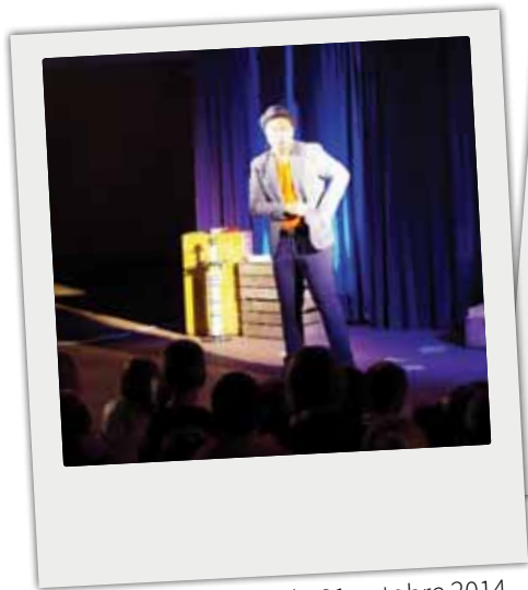
■ Soirée Halloween du 31 octobre 2014.

Retour en images sur les temps forts du dernier trimestre.