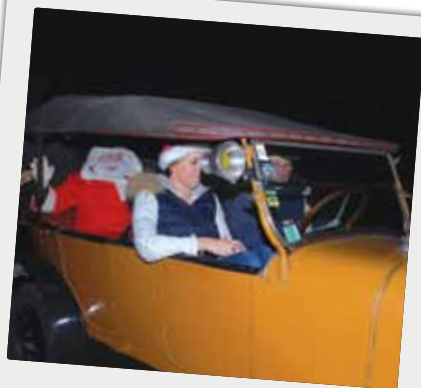
■ L'arrivée du Père Noël dans un drôle de traineau à l'école élémentaire, le 19 décembre 2014.