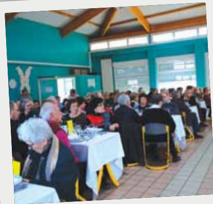
■ Repas des aînés au restaurant scolaire, le 1er février 2015.