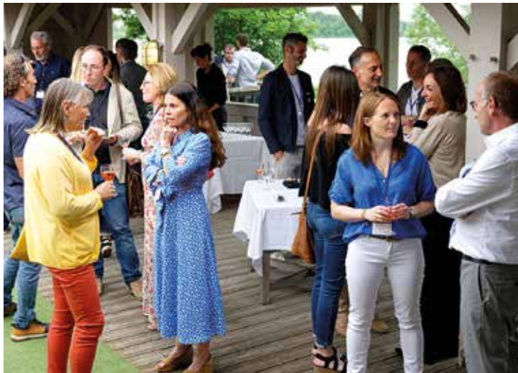
Réunion du club des entrepreneurs à la Maison du Fleuve.

Tous les vendredis matin autour d'un petit-déjeuner et une fois par mois lors d'afterworks, les membres du club se réunissent. Chacun parle de son activité comme il le souhaite. Ces présentations permettent de comprendre